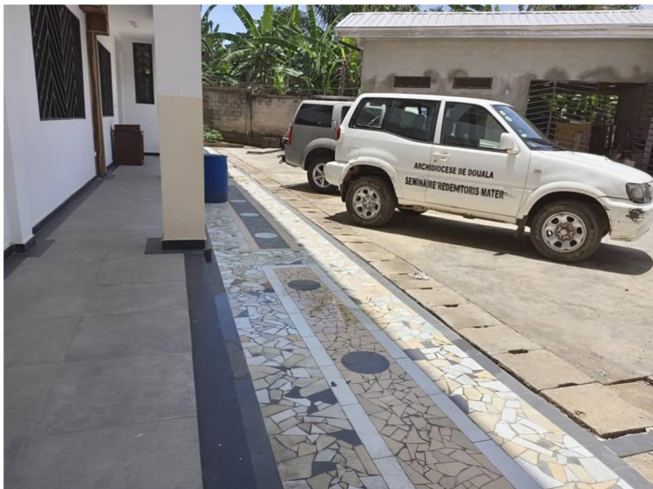
Figure 6 - Le nouveau revêtement de sol que nous posons autour du séminaire