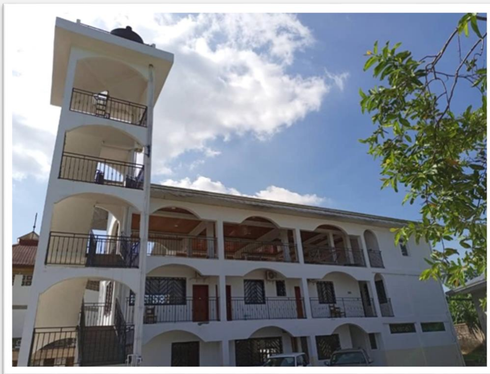
Figure 5 - La façade avec les escaliers vue du parking