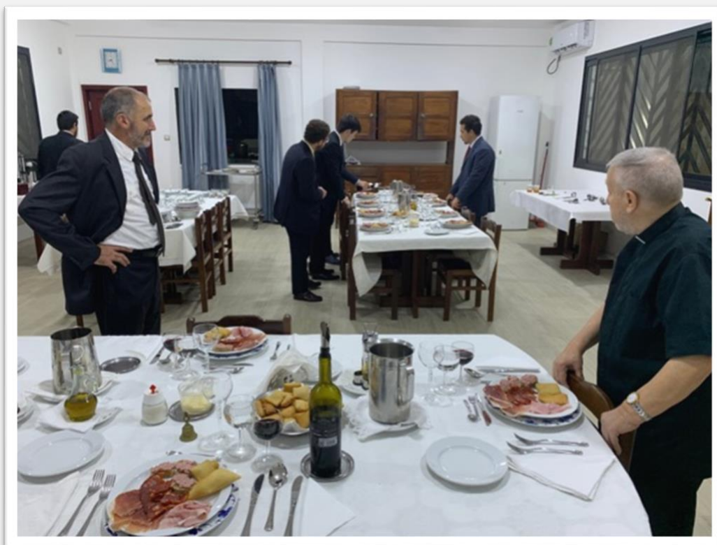
Figure 1 - Préparation du déjeuner festif

Samedi le 26 mars, nous avons accueilli les catéchistes qui nous aident dans le discernement vocationnel pour une journée de dialogue et de communion. Les séminaristes ont pu échanger sur leur vocation et étaient tous très heureux de l'opportunité qui leur était donnée de s'interroger profondément et de relire les faits de leur vie à la lumière de l'amour de Dieu et de son appel. La belle fête qui a suivi la rencontre a certainement aussi aidé : un moment de joie ensemble.