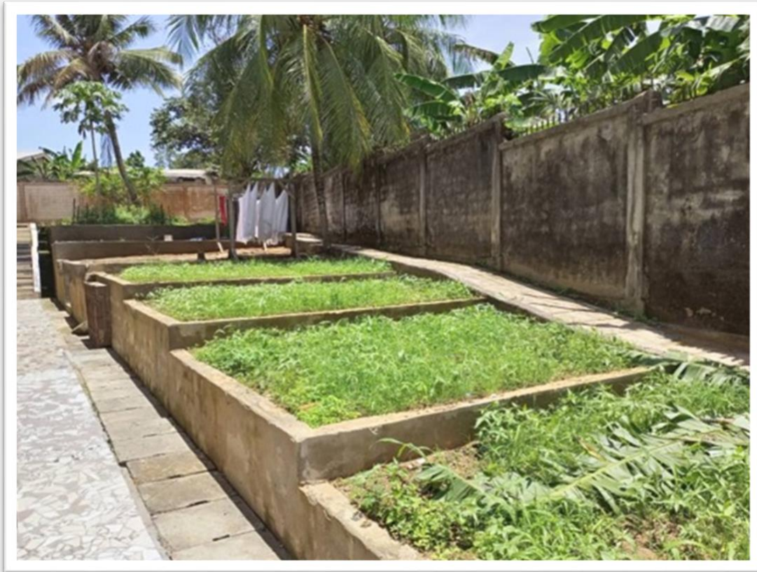
Figure 2 - Le jardin du séminaire avec ses terrasses

Nous avons pu terminer le deuxième trimestre et envoyer les séminaristes en vacances dans certaines familles des paroisses voisines, afin qu'ils puissent vivre la Semaine Sainte avec leurs communautés.