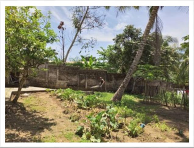
Figures 3 et 4 - Les plantes du jardin qui produisent déjà ou vont bientôt produire