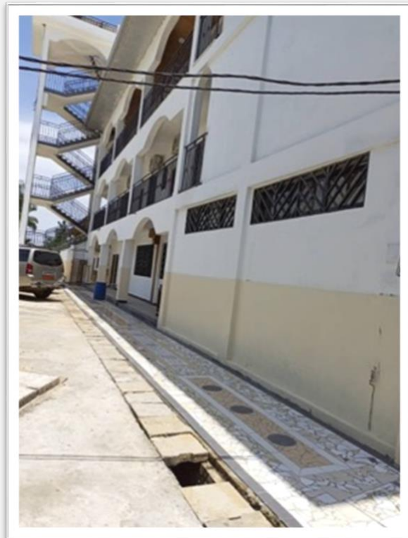
Figures 7 et 8 - Le nouveau revêtement de sol que nous posons autour du séminaire

Nous voudrions renouveler nos vœux pour une Sainte Pâques de Résurrection et un joyeux temps pascal : restons unis dans la prière et reconnaissants pour le passage de Dieu dans notre histoire, un Dieu qui nous cherche avec amour dans nos difficultés et notre esclavage, comme il a recherché les siens qui ont souffert en Égypte, et nous a entraînés avec Lui vers la liberté, la Terre Promise. Pour nous la Terre Promise est notre mission, où nous ne pourrions rien faire sans la présence constante de la Providence, sans le soutien de l'Esprit Saint, sans communion avec vous, chers amis, qui nous aidez de mille manières, spirituelles et matérielles. Comme dans un nouvel exode, nous essayons de marcher au rythme que Dieu nous dicte, scrutant pour discerner sa volonté, travaillant dur pour l'accomplir, et nous réjouissant de sa générosité avec nous : le Seigneur nous précède toujours, nous accompagne, nous reconforte quand nous sommes un peu abattus ; cela nous permet de nous réconcilier quand un désaccord surgit... quelle vie fantastique c'est celle de celui qui s'abandonne à la volonté de Dieu ! Nous espérons que ce soit la vôtre et notre vie !