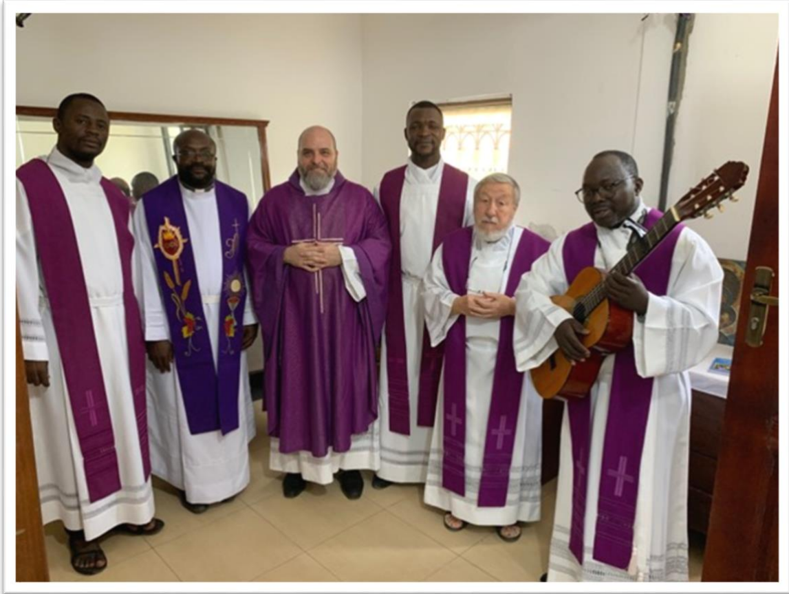
Figure 9- Les formateurs du séminaire et quelques-uns de nos prêtres après une messe dans la nouvelle chapelle

Comme d'habitude, vous trouverez quelques photos des événements que je vous ai décrits. Je voulais aussi vous confirmer que nous avons activé notre site internet, pas encore complet, mais déjà fonctionnel :