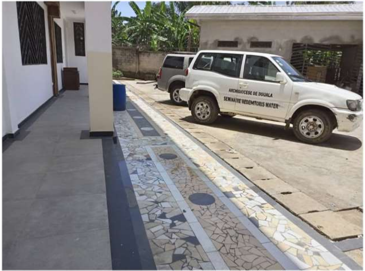
Figura 6 - La nuova pavimentazione che stiamo posando attorno al seminario