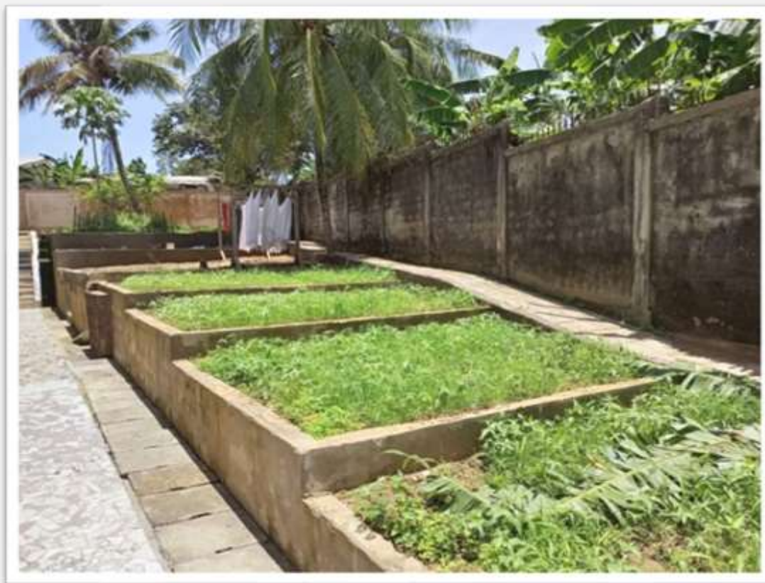
Figura 2 – L'orto del seminario con i suoi terrazzamenti

Abbiamo potuto finire il secondo trimestre e mandare i seminaristi in vacanza da alcune famiglie delle parrocchie vicine, perché vivano la settimana santa con le loro comunità.