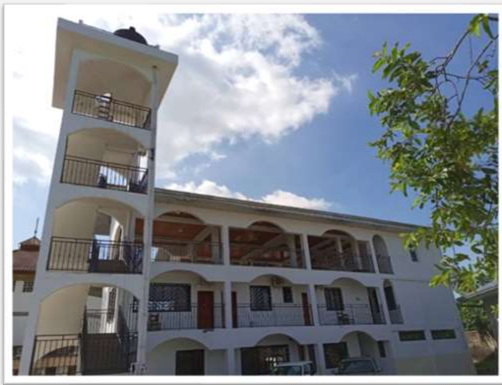
Figura 5 – La facciata con le scale viste dal parcheggio