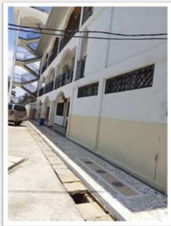
Figura 7 e 8 - La nuova pavimentazione che stiamo posando attorno al seminario

Vorremmo rinnovarvi i nostri auguri per una Santa Pasqua di Resurrezione e di un gioioso tempo pasquale: restiamo uniti nella preghiera e grati per il passaggio di Dio nella nostra storia, un Dio che ci cerca con amore nelle nostre difficoltà e schiavitù, come ha cercato il suo popolo che soffriva in Egitto, e ci trascina con sé verso la libertà, la terra promessa. Per noi la terra promessa è la nostra missione, dove non potremmo fare nulla senza la presenza costante della Provvidenza, senza il sostegno dello Spirito Santo, senza la comunione con voi, cari amici, che ci aiutate in mille modi, spirituali e materiali. Come in un nuovo esodo, cerchiamo di marciare al ritmo che Dio ci detta, scrutando per discernere la sua volontà, lavorando duro per compierla, e rallegrandoci della sua generosità con noi: il Signore ci precede sempre, ci accompagna, ci consola quando siamo un po' giù, ci permette di riconciliarci quando si crea qualche dissapore... che vita fantastica è quella che si abbandona alla volontà di Dio! Ci auguriamo che sia la vostra e la nostra vita!