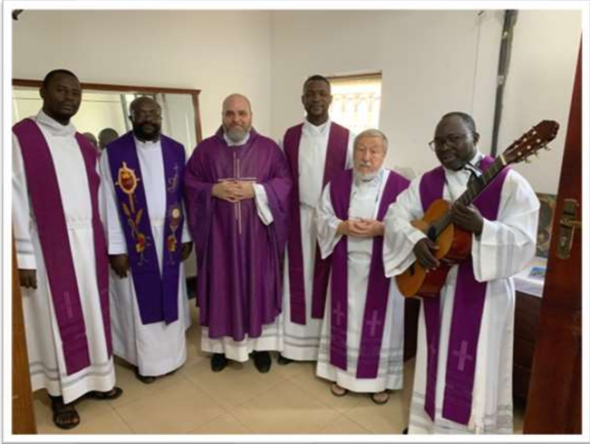
Figura 9- Il formatori del seminario ed alcuni dei nostri presbiteri dopo una messa nella nuova cappella

Come al solito troverete alcune foto degli eventi che vi ho descritto. Vi volevo anche confermare che abbiamo attivato il nostro sito internet, non ancora completo, ma già funzionante: