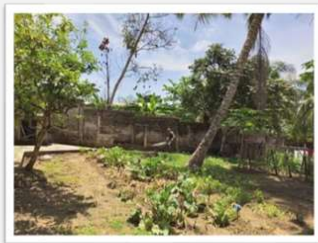
Figura 3 e 4 - Le piante dell'orto che stanno già producendo o che inizieranno tra poco