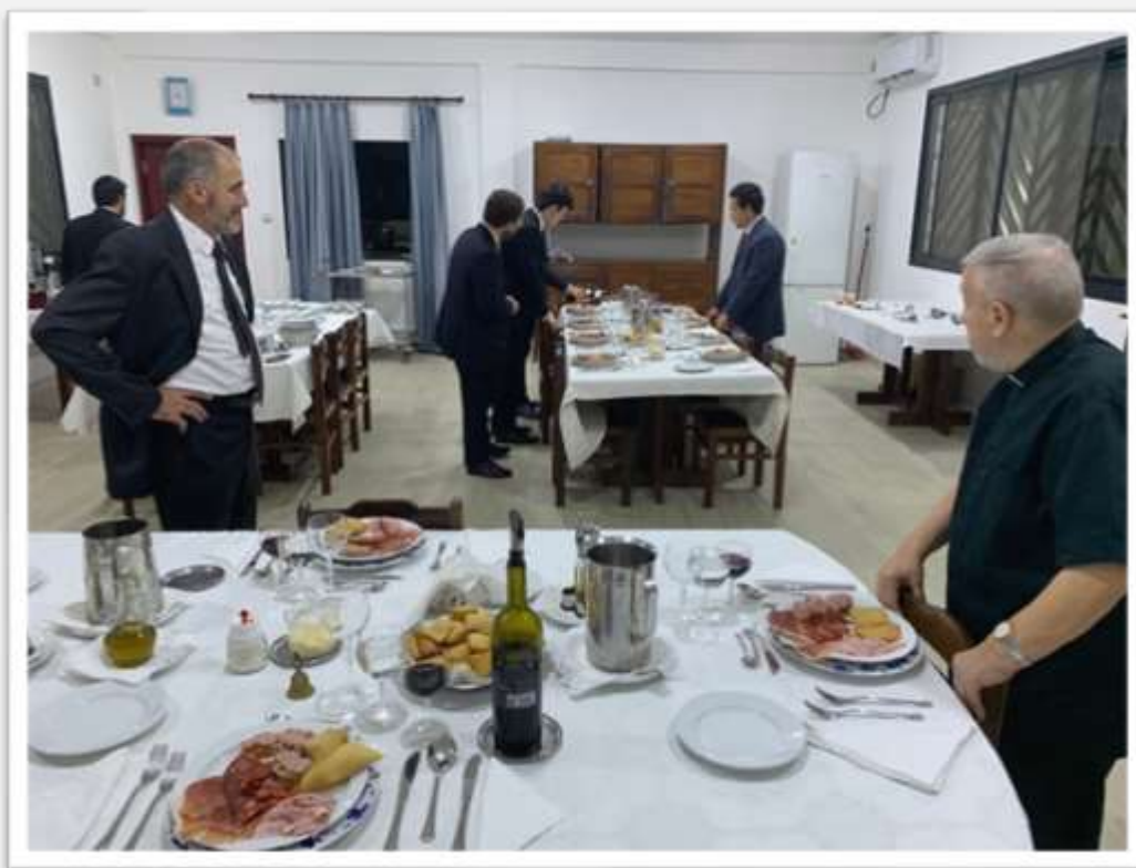
Figura 1 – La preparazione per il pranzo festoso

Sabato 26 marzo abbiamo ospitato i catechisti che ci aiutano nel discernimento vocazionale per una giornata di dialogo e di comunione. I seminaristi hanno potuto confrontarsi sulla loro vocazione e sono stati tutti molto contenti per l'occasione loro fornita di interrogarsi profondamente e di rileggere i fatti della loro vita alla luce dell'amore di Dio e della sua chiamata. Ha certamente giovato anche la bella festa che ha fatto seguito all'incontro: un momento di gioia insieme.